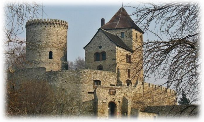
Jeden z licznych, okazałych zamków wybudowanych za czasów Kazimierza Wielkiego powstał w Będzinie

Poddani mu biskupi i magnaci, dołożyli do tej liczby 13 warowni. Dodając do tego powstanie 65 nowych miast, co najmniej 500 wsi, adekwatne stają się słowa Jana Długosza zastawszy Polskę glinianą, drewnianą, pozostawił murowaną, ozdobną i wspaniałą”.