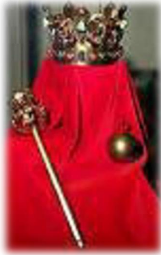
Insignia królewskie Kazimierza Wielkiego

Po przezwyciężeniu ciężkiej choroby, która zagrażała nawet jego życiu, brał udział w wojnie polsko-krzyżackiej (1327-1332). W takich niełatwych okolicznościach 25 kwietnia 1333 roku na Wawelu odbyła się koronacja dwudziestotrzyletniego Kazimierza na króla Polski.