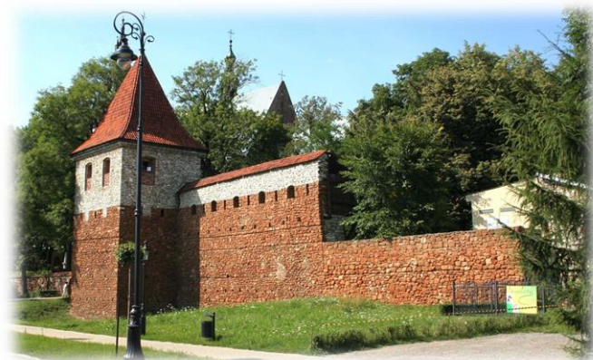
Mury obronne w Olkusz

Był władcą, który powiększył terytorium kraju, wzmocnił wewnętrznie swoje królestwo i zapewnił sobie szacunek na arenie międzynarodowej. Król Kazimierz wybudował 53 zamki, a 27 miast w tym Skawinę opasał obronnymi murami.